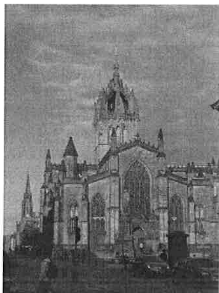
St. Giles' Cathedral. Die Hauptkirche der Church of Scotland, liegt direkt an der Royal Mile in der Edinburgher Altstadt.

auch gerade die biblischen Master- und Doktorsprogramme gefragt, Bibelwissenschaften genießen ein hohes Ansehen. Es mag manche überraschen, aber das ist auch der Grund, warum so viele Doktoranden am New College die deutsche Sprache lernen. Wenn sie ihre biblische Dissertation schreiben, müssen sie die Klassiker der deutschsprachigen Exegese lesen können. Nicht wenigen fällt das schwer. Viel Aufwand also, um die Bibel besser zu verstehen. Das hätte John Knox sicher gefallen.